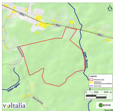
Carte d'analyse paysagère de l'aire d'étude immédiate (Voltalia -étude d'impact projet de centrale électrique hybride 2020)

- au paysage : le site présente actuellement un caractère forestier, le secteur élargi alternant milieu naturel et habitat rural diffus. Il est ponctuellement visible depuis la RN1 au nord et la piste Sainte-Anne à l'ouest.